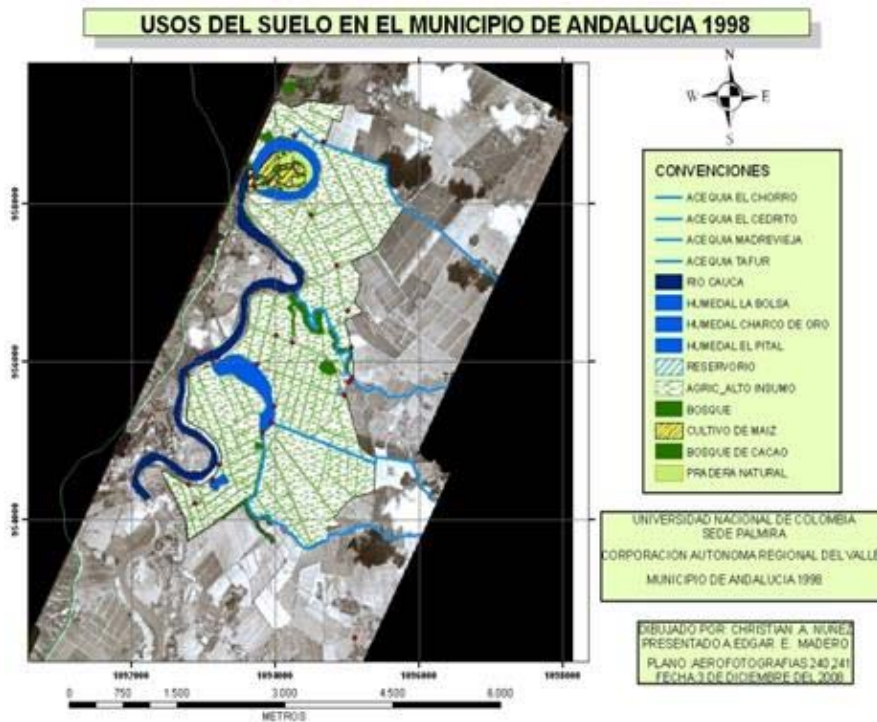
Figura 1. Aerofotografía digitalizada en el área de influencia de los humedales. 1994.